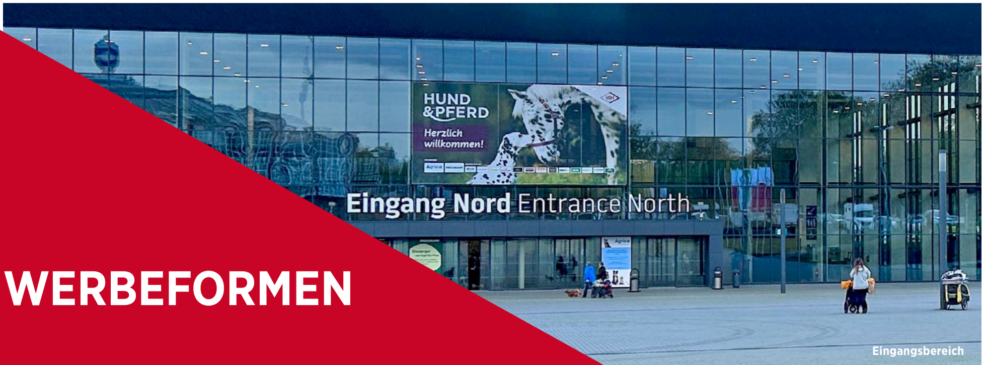
Eingang Nord Entrance North